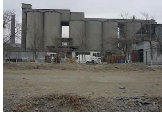
„ჰაიდელბერგემენტ ჯორჯია“ – გარემოს მოწესრიგებისა და გამწვანების საჭიროება აქაც გამოიკვეთა

რუსთავში, „ჯეოსთილის“ ქარხანასთან, საზოგადოებრივი მოძრაობის, „გავიგუდეთ“ აქტივისტებმა და მოქალაქეებმა საპროტესტო აქცია გამართეს. აქციის მონაწილეების თქმით, „ჯეოსთილი“ ფილტრების გარეშე მუშაობს და ქალაქს მავნე გამონაბოლქვით აბინძურებს. „დააყენე ფილტრები – გავიგუდეთ!“ 11 – ამ შეძახილებით, აქციის მონაწილეები საწარმოს ხელმძღვანელობას ფილტრების დაყენებისა და გარემოს მავნე გამონაბოლქვით დაბინძურების შეწყვეტისკენ მოუწოდებდნენ. აქ-