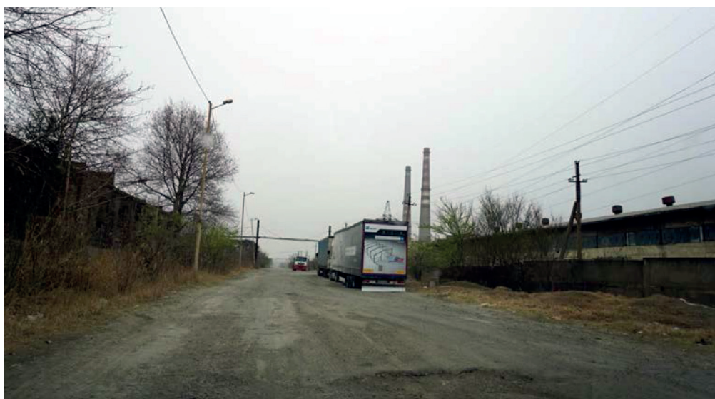
საწარმო „ჯეოსთილი“ – ადმინისტრაციულ შენობასთან არსებული მოუწესრიგებელი გზის საფარი

მომზადდა ფოტომასალა, რათა თვალსაჩინო ყოფილიყო რუსთავეში მოქმედი საწარმოების სამუშაო გა- რემოზე „ზრუნვის“ ფაქტები. გამო- იკვეთა, რომ ხშირ შემთხვევაში საწარმოთა ყურადღების მიღმა დარჩენილი გარემოს გამწვანების საკითხი და მეტად მძიმე ვითარებაა გზის საფარის მოწესრიგებისა და ნარჩენების გატანის მხრივაც.