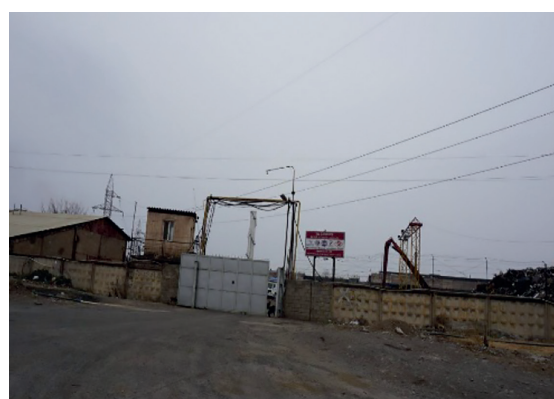
საწარმო „ჯეოსთილის“ – ტერიტორიაზე თვალსაჩინოა მოუწესრიგებელი გარემო და გამწვანების საჭიროება